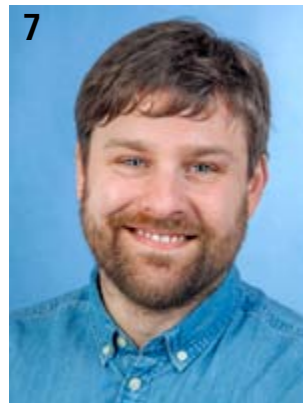
7 Marko Boost Spezialist IE