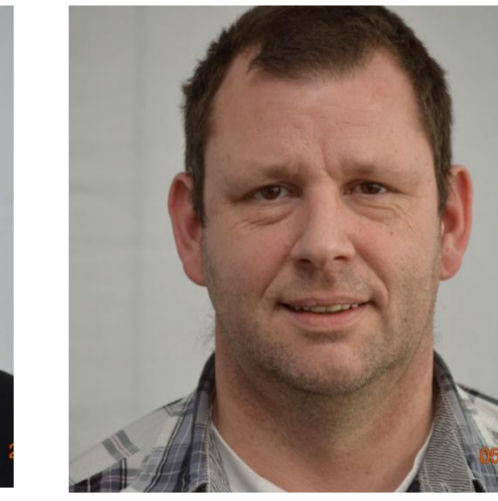
28. Martin Vogt Technologie S