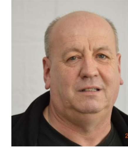
8. Edmund Scheidel Logistik S