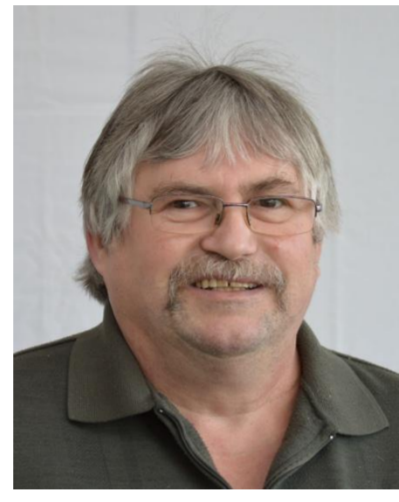
13. Johann Schröcke Technologie K